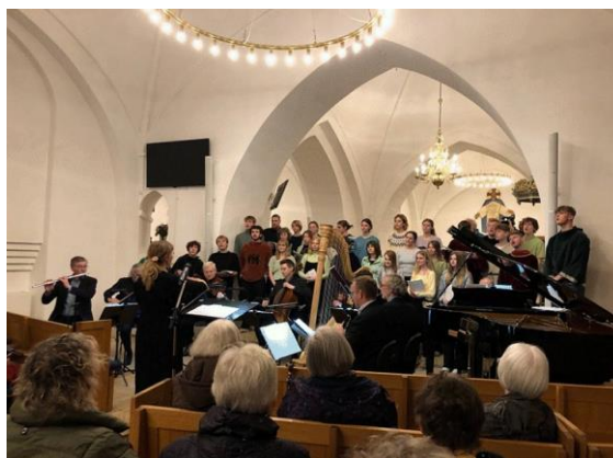
Koncert i Haslev Kirke