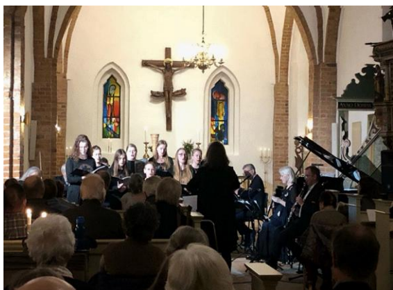
Koncert i Faxe Kirke

Foreningen skal tilgodese hele Faxe kommune, ikke mindst geografisk. Derfor har vi aktuelt koncertsteder i Faxe Kirke, Haslev Kirke, Kultunariet og Vemmetofte Kloster.