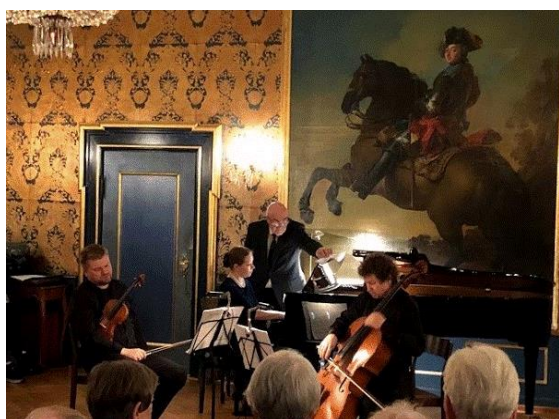
Koncert i Vemmetofte Kloster

Historisk har foreningen også afholdt koncerter på andre lokaliteter, herunder f.eks. Gisselfeld Kloster, Jomfruens Egede, Rønnede Kro, Ulse kirke, Sankt Peders Kapel, Haslev Udvidede Højskole, Galleri Emmaus, samt en række af Faxe Kommunes skoler og øvrige kirker.