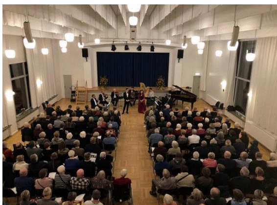
Koncert i Kultunariet